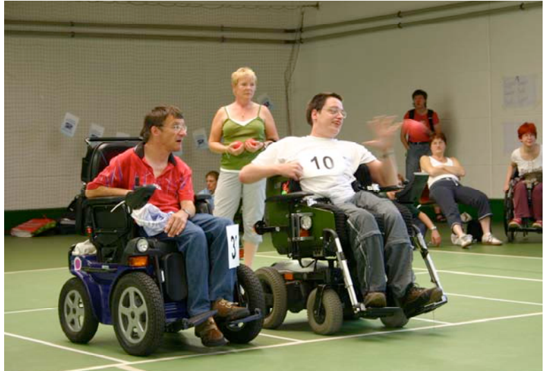
In unterschiedlichen Disziplinen traten die Sportlerinnen und Sportler gegeneinander an

Einen besonders spannenden Tag erlebten die Teilnehmerinnen und Teilnehmer bei den Leichtathletik-Wettkämpfen, die auf dem Gelände der Olympischen Spiele von 1972 stattfanden. Den Olympiaturm stets im Blick, das Olympiastadion mit dem bekannten zeltförmigen Dach in unmittelbarer Nähe und die Sonne an einem strahlendblauen Himmel beflügelten die Sportlerinnen und Sportler zu eindrucksvollen Leistungen.